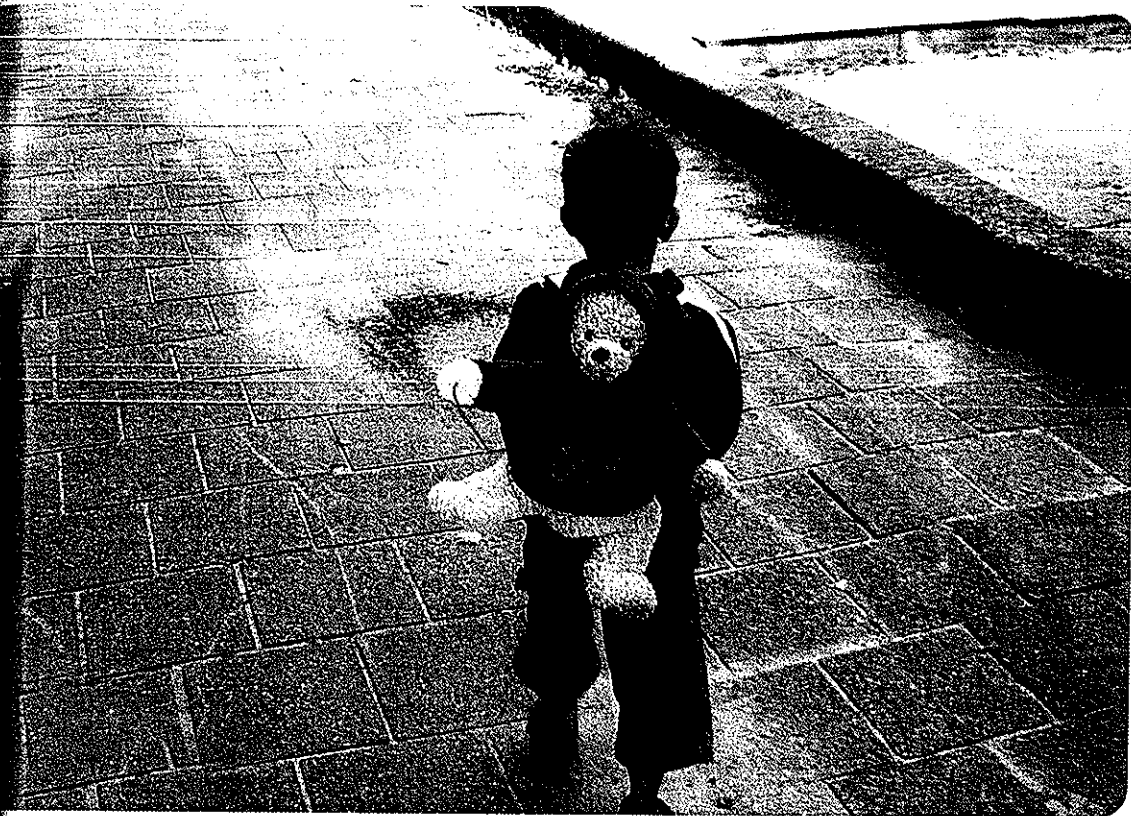
קליה צור, רמת אביב ג': "זה מגיע למצב שמשתמשים ברופאים ובפסיכולוגים כדי להוציא אישורים על דברים שלא היו ולא נבראו. עושים מהמשפחה מתפוררת, ושיקרה אסון גם לילד וגם להורה אם הילד לא ילך דווקא לאליאנס"

"זו דיילמת הדילמות. כי מעבר לבעיה התכנונית זו בעיה ערכית. כשהחליטו לעשות זאת, טענו שהתחרות תעלה את רמת בתי הספר. הרמה אכן עלתה בשנים האחרונות, אבל קשה להגיד אם זה בגלל השיטה או מסיבות אחרות."