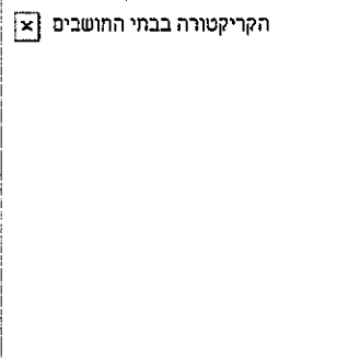
הקריקטורה בבתי החושבים

בעיריית תל אביב הזכירו השבוע: ~הגבול המפריד בין השטח המוניציפאלי של עיריית רמת השרון לבין השטח של עיריית תל אביב~ יפוע עובר בין שכונת נווה גן ברמת השרון ותל ברוך צפון בתל אביב-יפו ומשורטט באופן שמקשה על עיריית רמת השרון לספק שירותים עירוניים לשכונה הנמצאת בגבול בין שתי הרשויות. הגבול השרירותי הקיים